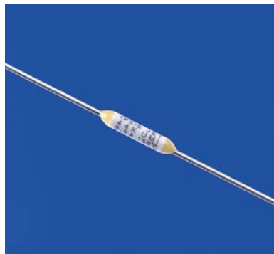
上記写真は44Kです。 The photo of 44K is shown.