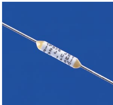
上記写真は12Jです。 The photo of 12J is shown.