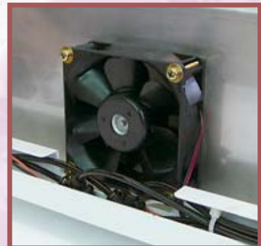
プリヒーター機能のファン